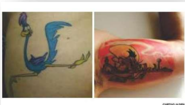
Figura do 'papa-léguas' ou 'ligeirinho' indicam uso de motocicletas para distribuição de drogas

Tatuagens com o demônio da Tasmânia sugeririam envolvimento com furto ou roubo, principalmente arrastões.