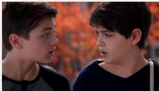
Na série Andi Mack da Disney, o personagem Cyrus se apaixona pelo seu melhor amigo ambos têm 13 anos.

Esse é apenas um dos exemplos do que a mídia tem colocado nas redes. Emissoras como: Globo e Disney tem propagado a ideia de que é tudo normal e licito. Mas nós como filhos de Deus devemos abominar as práticas do homossexualismo e lesbianismo.