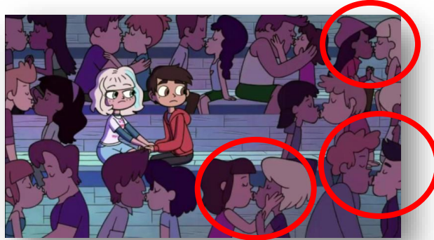
Diversas cenas de beijo gay são passadas em um desenho infantil